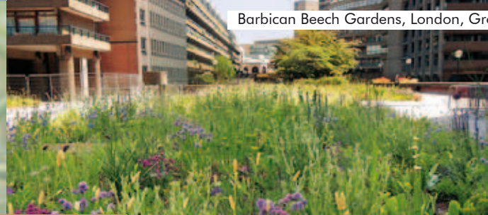
Barbican Beech Gardens, London, Großbritannien