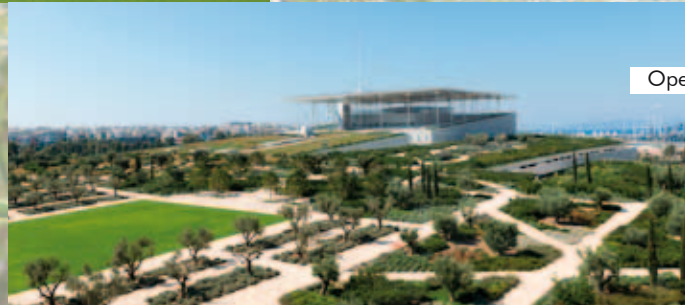
Oper, Athen, Griechenland