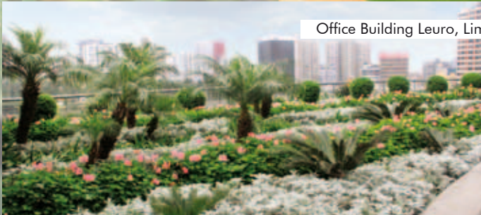
Office Building Leuro, Lima, Peru