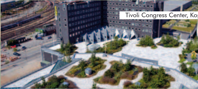
Tivoli Congress Center, Kopenhagen, Dänemark