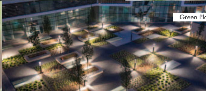
Green Place, Mailand, Italien