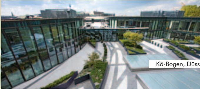
Kö-Bogen, Düsseldorf, Deutschland