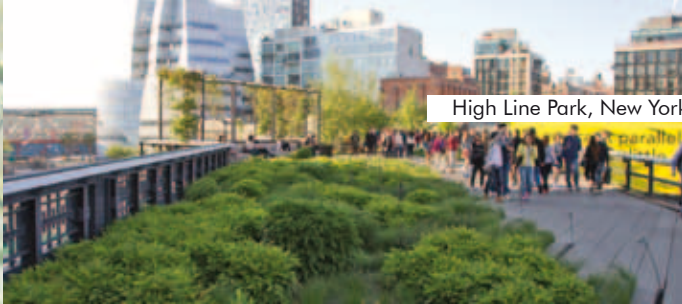
High Line Park, New York, USA