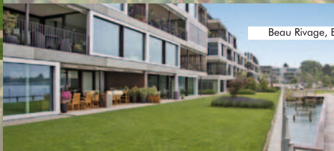
Beau Rivage, Biel, Schweiz