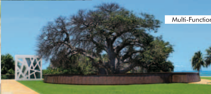
Multi-Function Hall, Daressalaam, Tansania