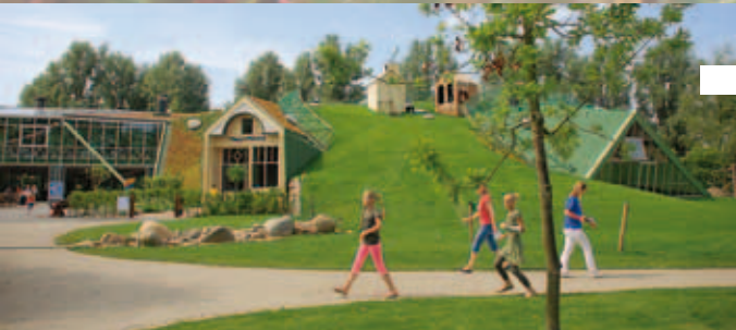
Plaswijckpark, Rotterdam, Niederlande