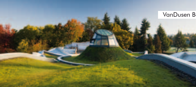
VanDusen Botanical Garden, Vancouver, Kanada