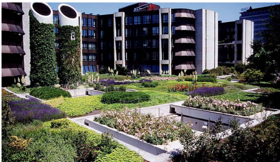
So stellte sich die Begrünung im Alter von ca. 8 Jahren dar.