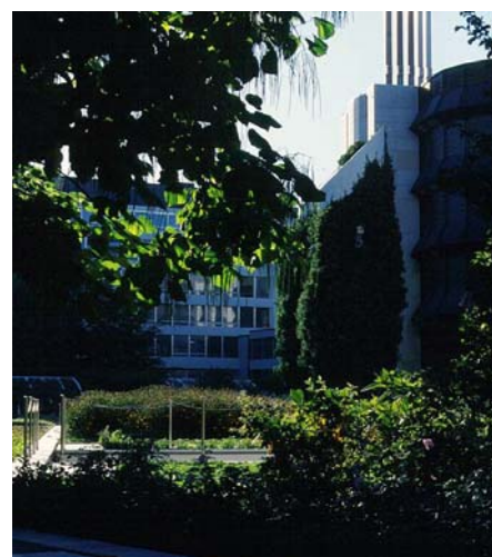
Die Bilder zeigen deutlich die üppige Entwicklung der Vegetation. Auch die Kletterpflanzen erhalten durch den Systemaufbau ausreichend Wasserreserven, um ihren arttypischen Habitus zu entwickeln.