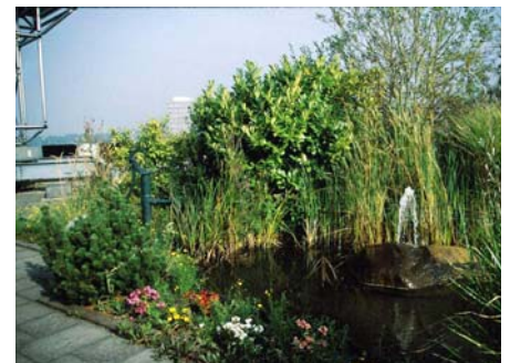
Eine sommerliche Wechselbepflanzung ergänzt die Dauerbepflanzung mit Gehölzen, Stauden und Gräsern.

Die ans Wasser anschließende Terrasse wird gerne für erholsame Mittagspausen aber auch für Besprechungen genutzt.