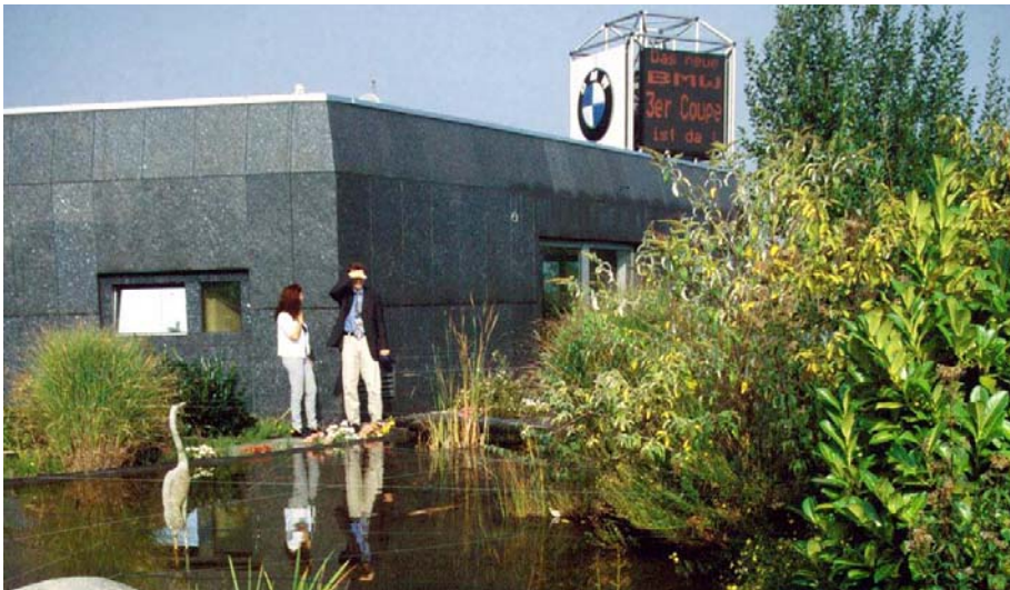
Ca. 20 m hoch liegt diese Gartenanlage mit Teich auf dem BMW-Gebäude in Düsseldorf.