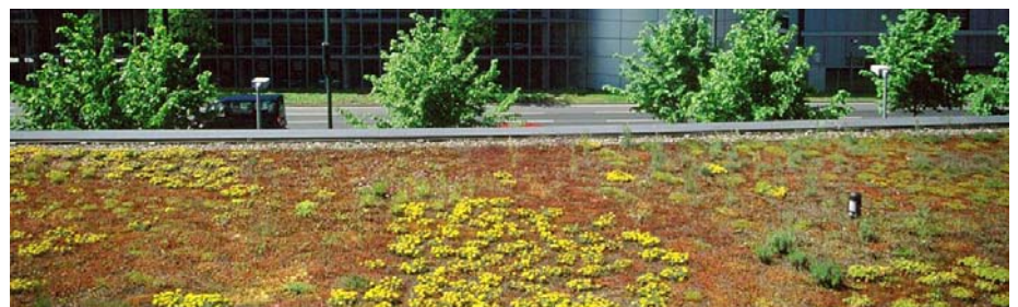
Direkt vor den Fenstern des „Für-uns-Shops“ erstrecken sich die 600 m 2 Natur mit „Kriechendem Thymian“ und „Mildem Mauerpfeffer“.