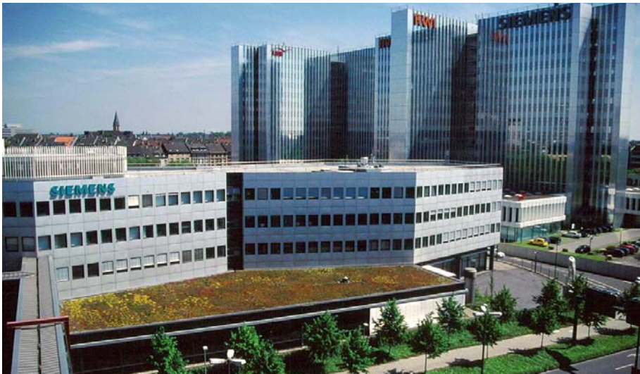
Blick vom gegenüberliegenden Parkhausdach auf das blühende Gründach.