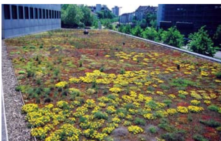
Im Vorübergehen können Besucher wie auch Mitarbeiter einen Blick von der Fußgängerbrücke auf das Gründach werfen.