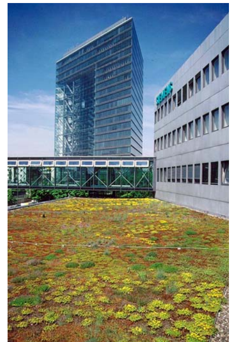
Am Ende des blühenden Kantindaches führt die Fußgängerbrücke über die stark befahrene Völklinger Straße.