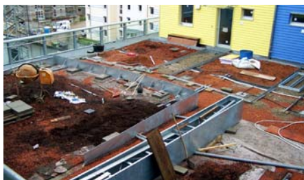
Bau der Sonnenterrasse und der Grünflächen.