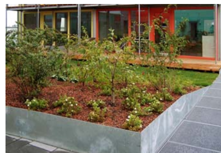
Blick auf ein Hügelbeet in dem Sträucher als Sichtschutz gepflanzt wurden.