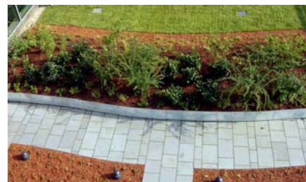
Blick von einem der Penthäuser auf den davor liegenden Dachgarten.