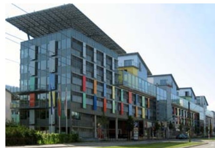
Auf dem „Deck“ des „Sonnenschiffs“ sind die Penthäuser zu sehen, zwischen denen die Dachgärten liegen.