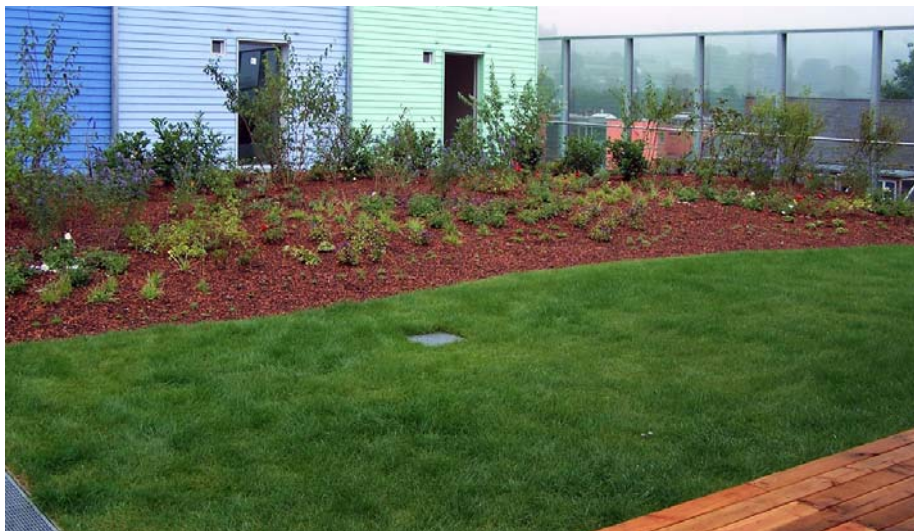
Ein Dachgarten des „Sonnenschiffs“ mit Holzterrasse, Rasenfläche und Sichtschutzpflanzung.