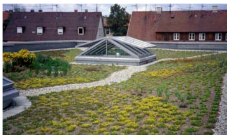
nach der Fertigstellung (Mai 1992).