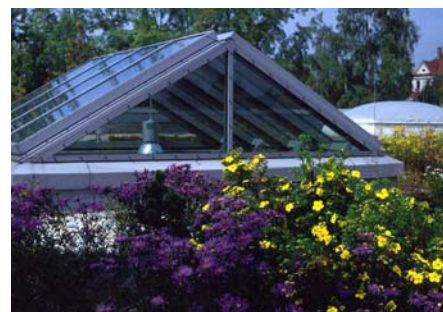
Detailansichten im September 1993 (oben) und im Juni 1996 (unten).

Durch eine vorbildliche Pflege blieb der Charakter des gestalteten Gründaches sehr gut erhalten. Das Novemberbild zeigt, wie ansprechend ein solches Dach auch zu dieser Jahreszeit ist. Die Gehölze übernehmen jetzt in vollem Umfang ihre Funktion als strukturierende Elemente.