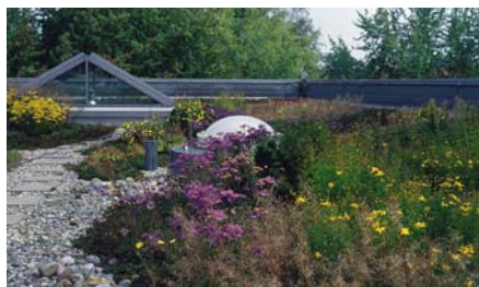
nach weiteren 2 Jahren (Mai 1994).