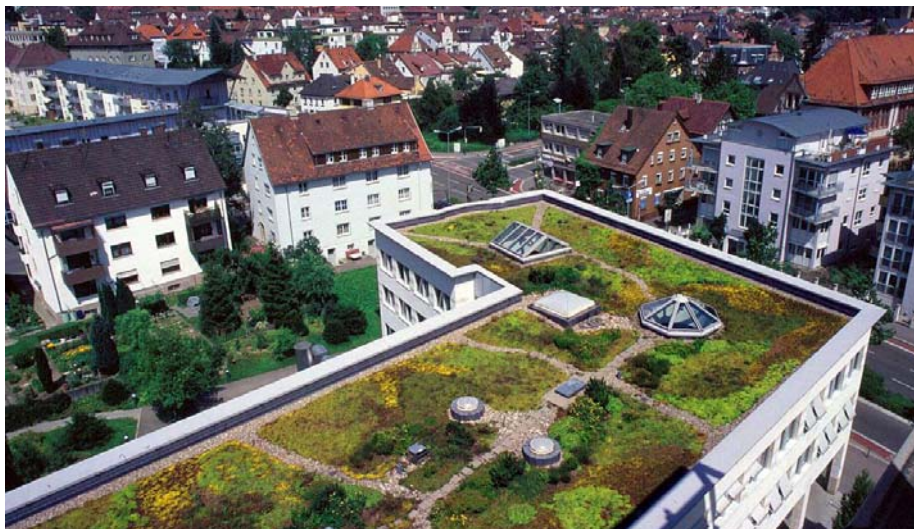
Blick vom Landratsamt auf das Gründach (Foto Mai 1995).