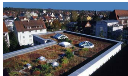
Herbstaspekt (November 2001).