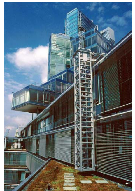
Der über 70 m hohe gläserne Büroturm der Nord-LB Hannover wurde inzwischen zum neuen Wahrzeichen der Stadt.