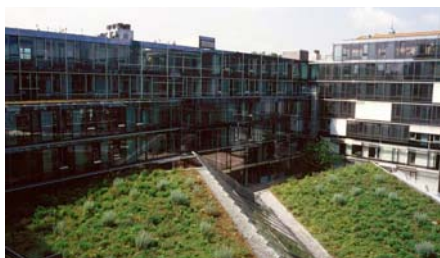
Eine Tröpfchenbewässerung auf dem Dach des Betriebsrestaurant sorgt auch im Sommer für üppiges Grün.