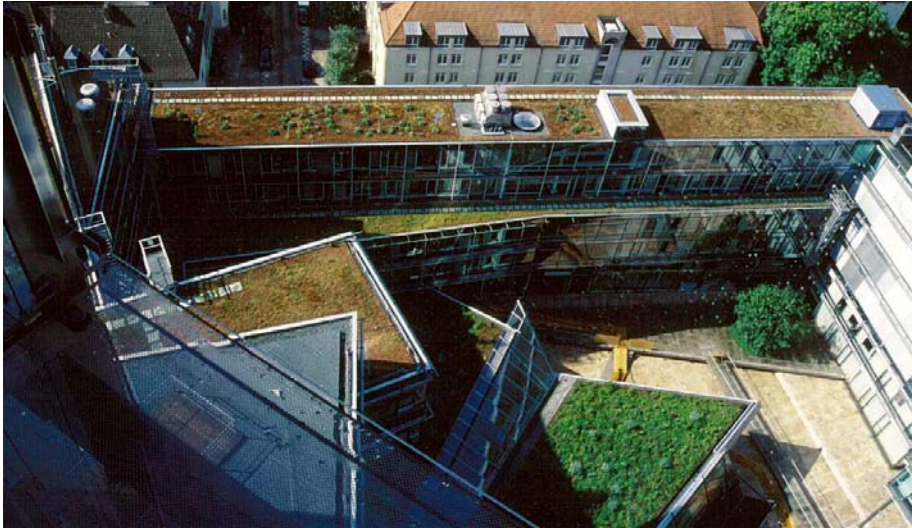
Rund 5.000 m 2 begrünte Dachfläche umfasst der Neubau der Nord-LB in Hannover.