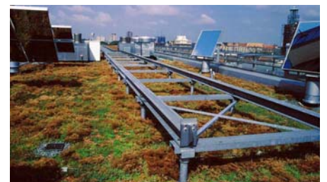
Sedum-Begrünungen auf nicht begehbaren Dachflächen erstrecken sich bis auf rund 50 m Höhe.