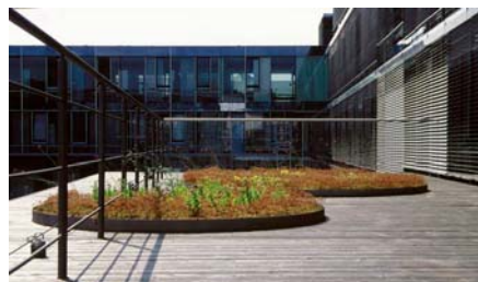
Unter den Holz- und Natursteinbelägen sorgt Elastodrain® EL 202 für den Schutz der Abdichtung.