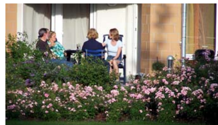
Sommerlieder und Rosenbeete trennen die privaten Terrassen von den öffentlich zugänglichen Grünflächen.