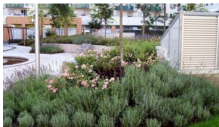
Im Bereich der Baumquartiere wurde das Substrat angehügelt; die Baumstämme wurden mittels Edelstahlseilen an großen Schachtringen aus Beton befestigt.