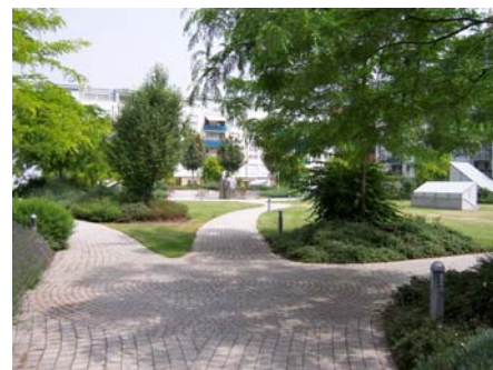
Die Wege, die es möglich machen, den Platz von allen drei Seiten zu erreichen.