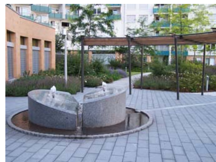
Ein weiterer Springbrunnen.