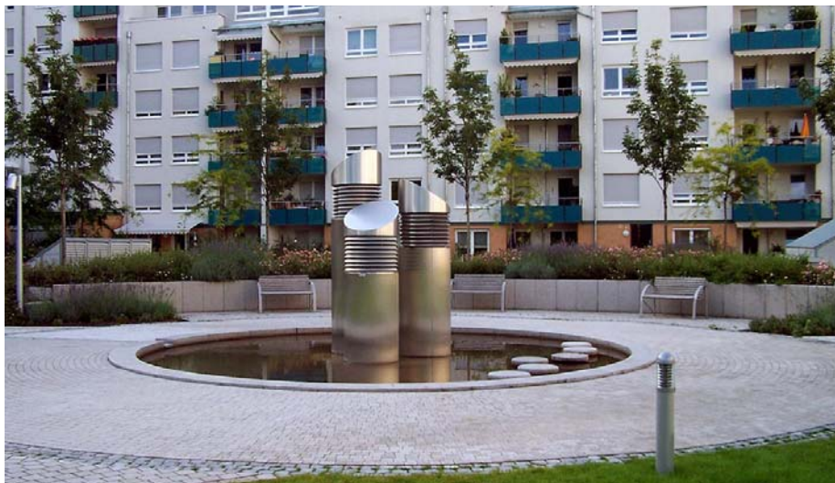
Der von drei Seiten erreichbare zentrale Platz mit Wasserspiel lädt zum Verweilen ein.