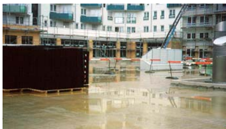
Bis zu 80 m beträgt die Entwässerungstrecke zur Tiefgaragen-Kante. Für Floradrain® FD 60 auch bei gefälleloser Deckenausbildung noch leistbar.