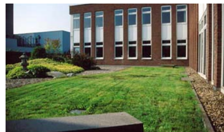
Der Rasen auf dem Dach muss regelmäßig gemäht werden.