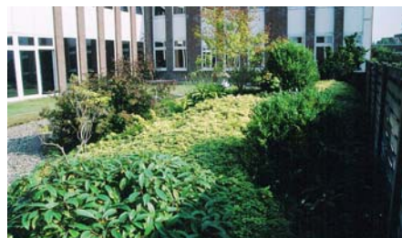
Die Sichtschutzwand zum Parkplatz hin wird etwas verdeckt durch bodendeckende Stauden und unterschiedlichste Gehölze.