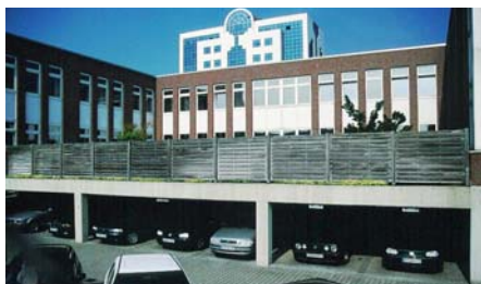
Unterhalb der Dachbegrünung stehen geschützt die parkenden Wagen der Angestellten.