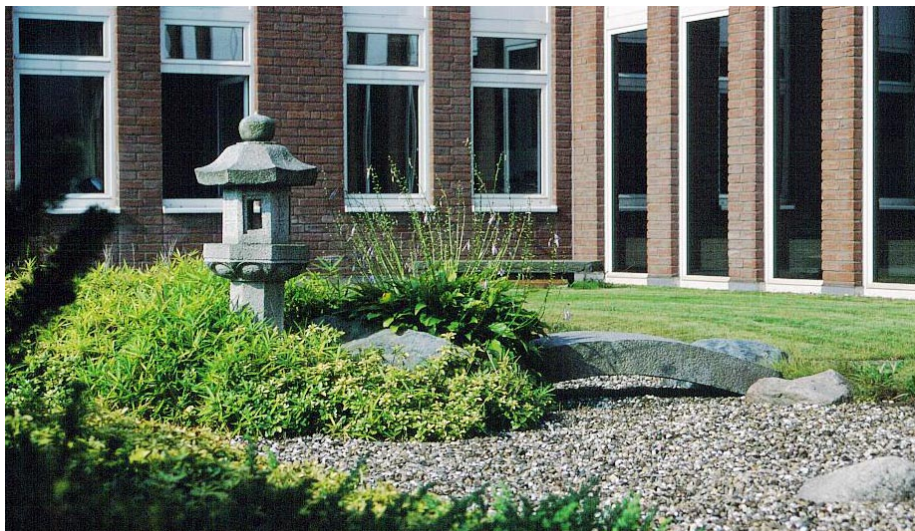
Japanische Gestaltungselemente prägen die Gartenanlage und strahlen Harmonie aus.