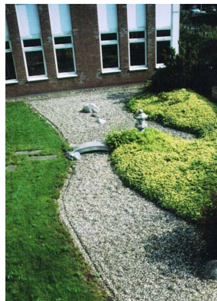
Die Rasenfläche, in die Schrittplatten integriert wurden, wird durch ein geschwungenes Band aus Kieselsteinen begrenzt.