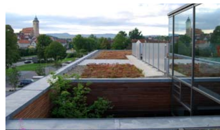
Das extensiv begrünte Dach im Sommer 2007.