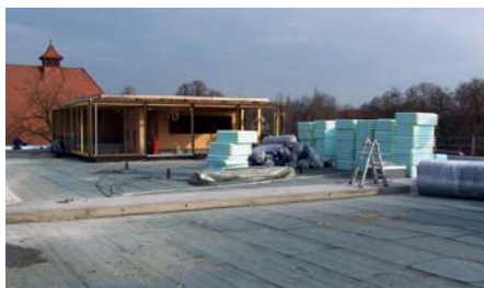
Das neu abgedichtete Flachdach vor Beginn der Begrünungsarbeiten.