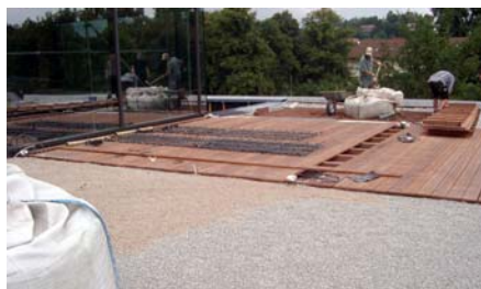
Verlegung der Holzdielen im zukünftigen Terrassenbereich.