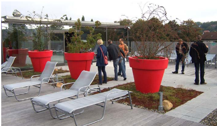
Der neue Wellness-Außenbereich auf dem Dach des Nürtinger Hallenbads.