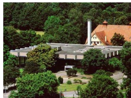
Vor den Sanierungs- und Renovierungsarbeiten war das Dach mit Kies bedeckt.

WD 120-H auf der 1.700 m 2 großen Dachfläche installiert. Floratherm® WD 120-H ist ein bauaufsichtlich zugelassenes Drainage- und Wasserspeicherelement mit einem anrechenbaren Wärmedämmwert, der ungefähr 9 cm üblichem Dämmstoff entspricht. Der neue Begrünungsaufbau spart Energie und reduziert somit die Heizkosten für das Gebäude.