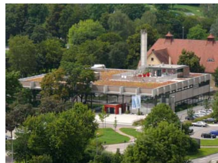
Seit der Sanierung wird ein Teil des Daches als Terrasse genutzt, die restliche Fläche wurde extensiv begrünt.