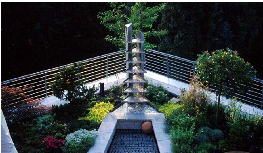
Blick vom Obergeschoß auf die neu angelegte Begrünung einer Terrassenwohnung in Rösrath mit dem Designer-Springbrunnen aus Edelstahl als Blickfang.