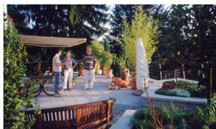
Die Kombination von grünendem Hochbeet und Terrasse ist gelungen.