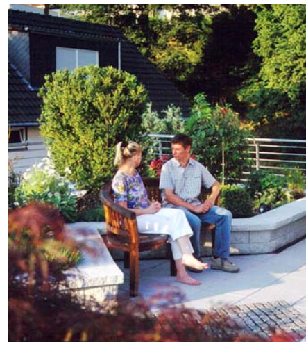
Eine gemütliche Bank neben einem duftenden Rosenstrauch lädt zum Verweilen ein.