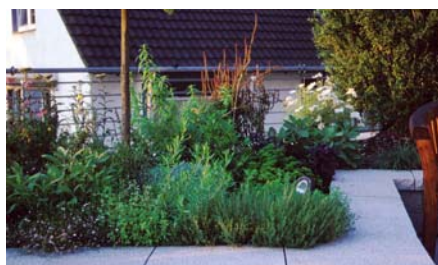
Auch nach heftigen Stürmen stand der Ginkgo wie zuvor dank perfekter Verankerung mittels Baumgurt an im Erdreich verlegten Stahlgitter.