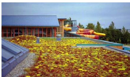
Beim „Sedumteppich“ wurde eine Mischung aus verschiedenen Sedum-Arten als Sprossen aufgebracht.