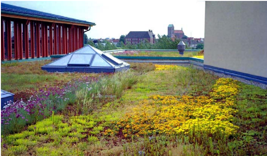
Das etwas mehr als ein Jahr alte Gründach im August 2002.