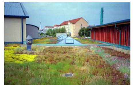
Dieselbe Dachfläche aus entgegengesetzter Richtung gesehen nach Etablierung der Bepflanzung.