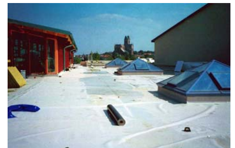
Die mit einer einlagigen, wurzelfesten Kunststoffbahn abgedichteten Dachfläche kurz vor Beginn der Begrünungsarbeiten.

wurde daher eine Begrünung des Typs „Sedumteppich“ gewählt, partiell ergänzt durch den Typ „Steinrosenflur“ mit zusätzlichen Stauden und Gräsern. Als Drainage wurden Floraset® FS 50-Elemente verlegt, die trotz des geringem Dachgefälles dafür sorgen, dass die Pflanzen einen „trockenen Fuß“ behalten.