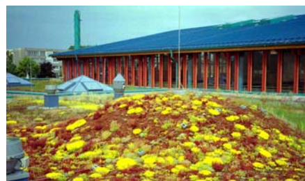
Auch dieser künstliche Hügel wurde mit dem „Sedumteppich“ begrünt.