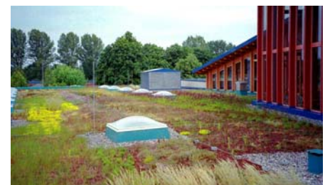
In der Pflanzengemeinschaft „Steinrosenflur“ sind neben Sedum-Arten auch Gräser und Nelken enthalten.