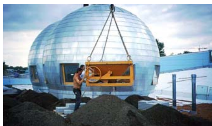
Mittels Baukran und Schütte wurde das Dachgartensubstrat in einer Stärke von ca. 20 cm aufgebracht.