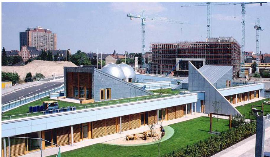
Die Kindertagesstätte mit Ihren Gründächern kurz vor der Einweihung.