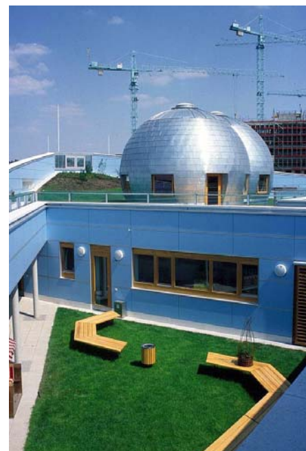
Die Kita des Deutschen Bundestages bietet auf allen Ebenen Spielmöglichkeiten für die Kinder.