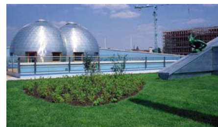
Zwischen den Rasenflächen wurden Inseln mit niedrigwachsenden Sträuchern angelegt.