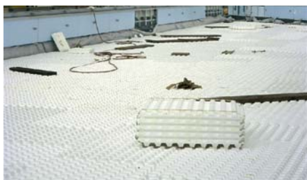
Die als Drainage und Wasserspeicher wirkenden Floratherm®-Elemente dürfen als Zusatzwärmedämmung angerechnet werden.