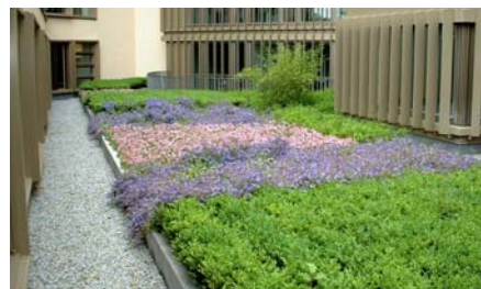
Eines der Pflanzbeete aus der Nähe betrachtet.