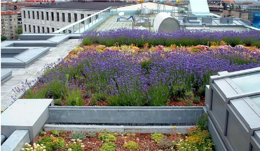
Über den Dächern von Berlin – Dachterrasse des Gebäudes Leipziger Platz 9 (ehem. Südpalais).