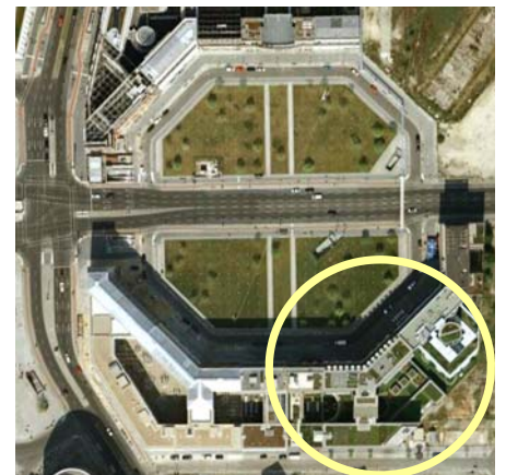
Die Gebäude „Leipziger Platz 9“ liegen im Südosten des im Wiederaufbau befindlichen Oktagons. Auch die später hinzugekommenen Gebäude wurden mit ZinCo Systemen begrünt.