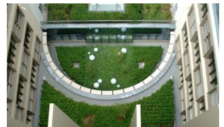
Ein Blick in die Tiefe des schattigen Innenhofs.