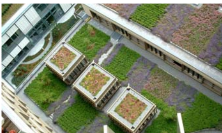
Die verschiedenartig bepflanzten Flächen wirken wie ein großes Muster.