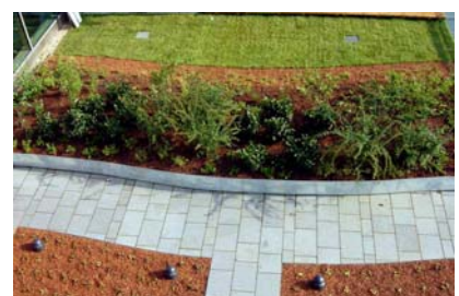
Blick von einem der Penthäuser auf den davor liegenden Dachgarten.