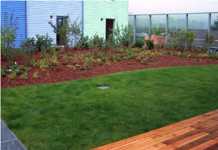
Ein Dachgarten des „Sonnenschiffs“ mit Holzterrasse, Rasenfläche und Sichtschutzpflanzung.