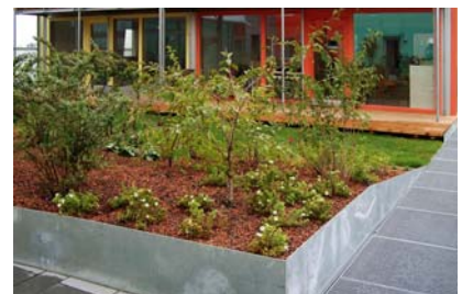
Blick auf ein Hügelbeet in dem Sträucher als Sichtschutz gepflanzt wurden.