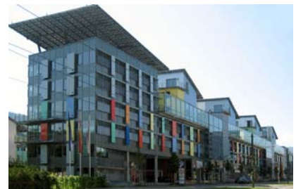
Auf dem „Deck“ des „Sonnenschiffs“ sind die Penthäuser zu sehen, zwischen denen die Dachgärten liegen.

Das „Sonnenschiff“ dient als Abriegelung zwischen der Merzhauser Straße und der Solarsiedlung Freiburg-Schlierberg. Auf dem „Deck“ des „Sonnenschiffs“ stehen neun zweigeschossige Penthäuser. Zwischen den Penthäusern ist eine bemerkenswerte Flachdach-Landschaft aus Rasenflächen, Hügelbeeten, Wegen und Terrassen entstanden. Die Statik der Dachkonstruktion erlaubt bis zu 40 cm Substrataufbau. Dadurch wurden auch Gehölze als Sichtschutz-Pflanzungen möglich. Die nach Süden gerichteten Schrägdächer der Penthäuser sind komplett mit Fotovoltaik-Anlagen belegt und produzieren wesentlich mehr elektrische Energie als in den Häusern benötigt wird, bestätigt Architekt Rolf Disch.