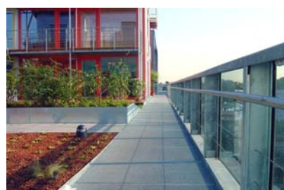
Entlang der Penthäuser und Gärten verläuft ein Weg aus Gitterrosten.