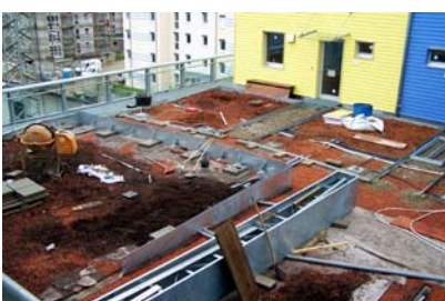
Bau der Sonnenterrasse und der Grünflächen.