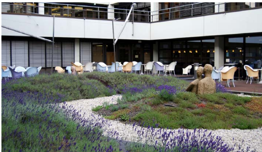
Der große Innenhof wurde mit Kunstobjekten versehen, die von Lavendel und Stauden umgeben sind.