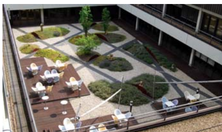
Für die Mitarbeiter wurde im großen Innenhof eine Holzterrasse mit Sitzgelegenheiten angelegt.