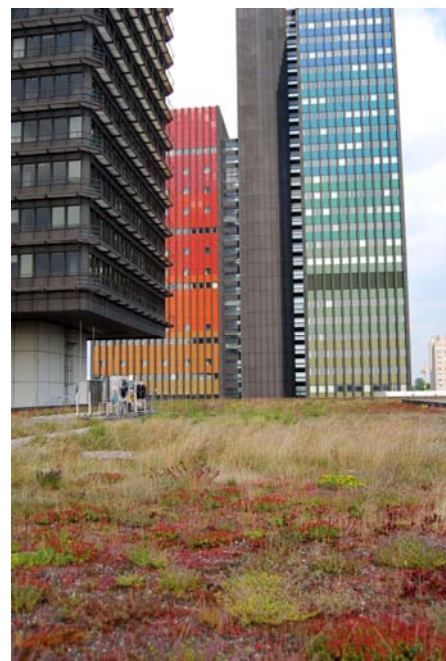
Die ehemaligen Rundfunkgebäude der Deutschen Welle sind im Hintergrund zu sehen. Das rote Gebäude war der Studioturm und das blaue der Büroturm.

Pflanzebene „Lavendelheide“ Systemerde „Lavendelheide“ Systemfilter SF Floradrain® FD 40 Speicherschutzmatte SSM 45 Dachaufbau mit wurzelfester Abdichtung