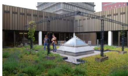
Im kleineren Innenhof wurden Pflanztröge mit Rankgittern für diverse Kletterpflanzen vorgesehen.