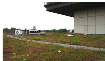
Die blühende Dachfläche im Sommer 2010, etwa vier Jahre nachdem die Dachbegrünung ausgeführt wurde.