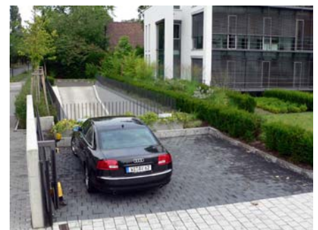
Diese Stellplätze liegen direkt über der Zufahrt zur Tiefgarage.