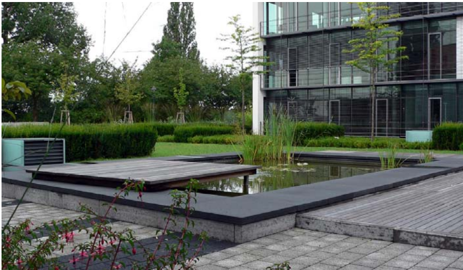
Unter dieser Gartenanlage mit Teich befindet sich eine Tiefgarage.