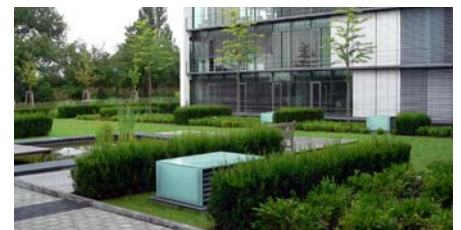
Nur die Lüfter deuten auf die darunterliegende Tiefgarage hin.