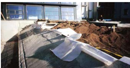
Hier wurde die Decke der Tiefgarage abgeschrägt.