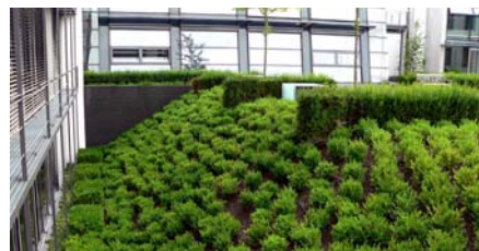
Die Schräge nach der Bepflanzung mit Bodendeckern.