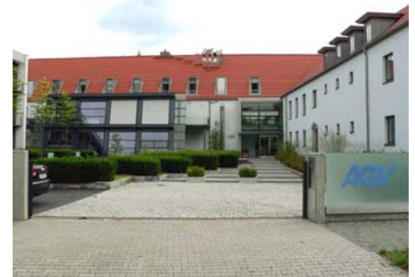
Zufahrt zum Geschäftsgebäude der Leasinggesellschaft in Mainz-Kastell, Wiesbaden.