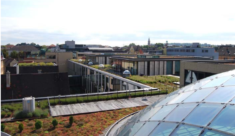
Blick von der Glaskuppel entlang des Erschließungsstrangs in Richtung Altbau.