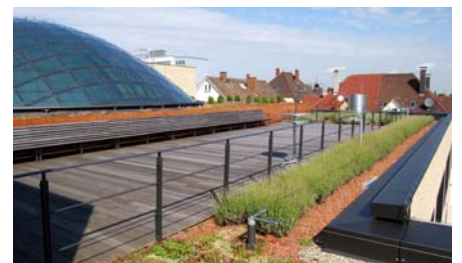
Die Dachfläche über dem Veranstaltungsraum wurde als Terrasse ausgebildet.