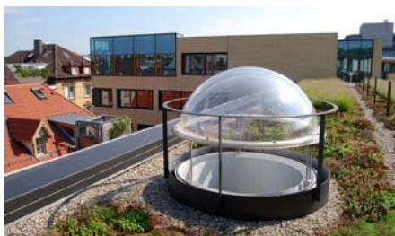
Um die Lichtkuppeln herum wurde der Bewuchs bewusst niedrig gehalten.