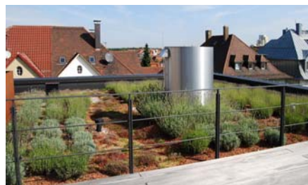
Für diese gut einsehbare Fläche wurde die Pflanzengemeinschaft „Lavendelheide“ gewählt.