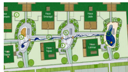
Der inzwischen umgesetzte Entwurf des Landschaftsarchitekten.

Der Scharnhäuser Park wurde insgesamt kinderfreundlich gestaltet; aus diesem Grund wurde auch im „Blauen Garten“ ein Spielplatz angelegt, sowie ein künstlicher Bachlauf, der in einen kleinen Teich mündet. Aufgrund der anspruchsvollen intensiven Begrünung entschied man sich für den Einbau von Floradrain® FD 60 Elementen, als bewährter Unterbau für Gestaltungsideen jeglicher Art.