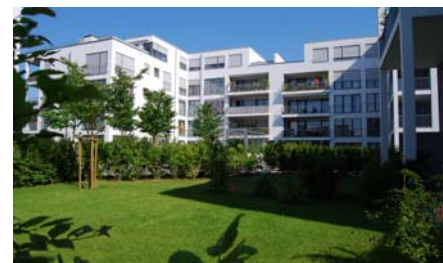
Noch sind die frisch gepflanzten Bäume relativ klein.