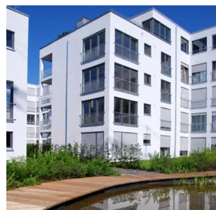
In diesen Teich mündet der künstlich angelegte Bachlauf.