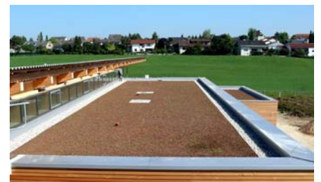
Blick auf ein fertiggestelltes, bereits mit Sedum-Sprossen bestücktes Dach.