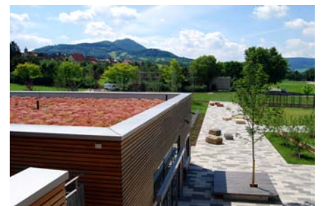
Blick auf das Dach und auf die umliegende grüne Landschaft mit der Burg Teck im Hintergrund.