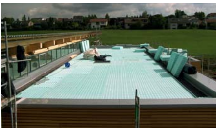
Verlegung der wärmedämmenden Dränelemente Floratherm® WD 65-H.