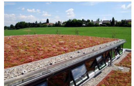
Flächendeckend und schön blühend zeigt sich das Dach bereits in der zweiten Vegetationsperiode.