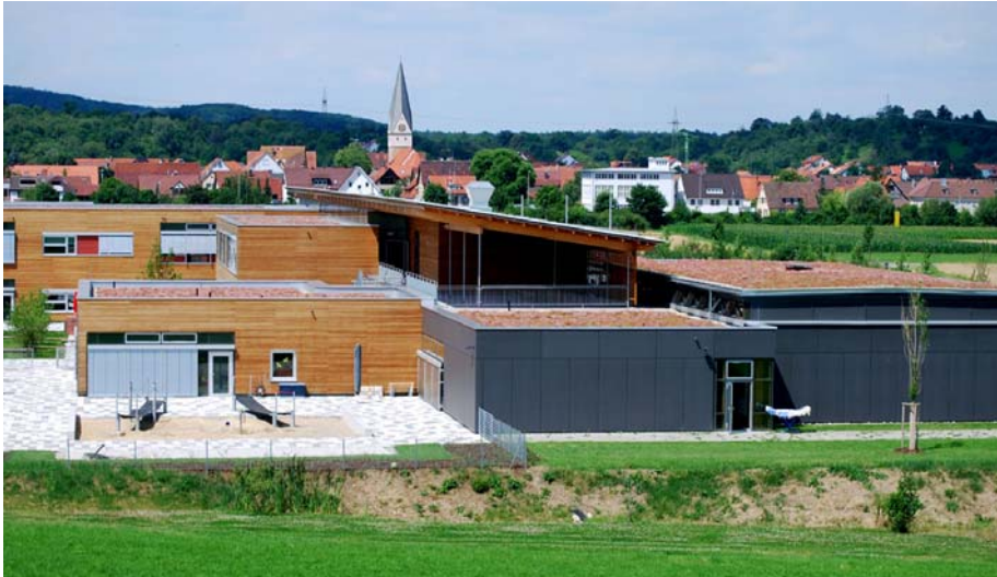
Die Verbundschule für körper- und sprachbehinderte Kinder in Dettingen/Teck ist mit Ihrer wärmedämmenden Dachbegrünung ökologisches Vorbild.