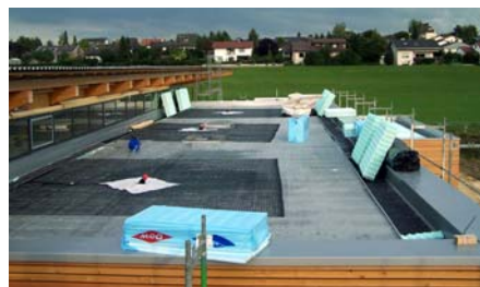
Das Absturzsicherungssystem Fallnet® SK bei der Installation.