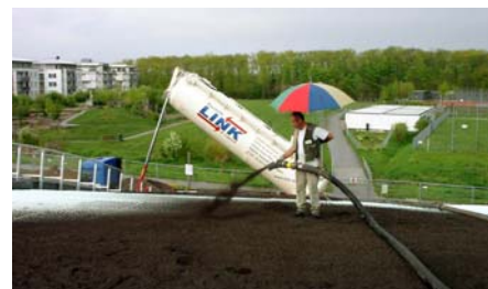
Das Substrat wird auf das Dach geblasen.