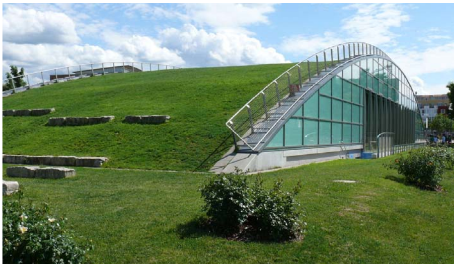
Das tonnenförmige, begehbare Sporthallendach der Clara-Grunwald-Schule in Freiburg-Rieselfeld.