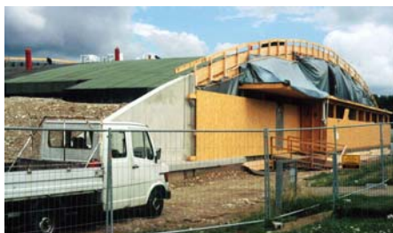
Das abgedichtete Dach vor Beginn der Begrünerarbeiten.