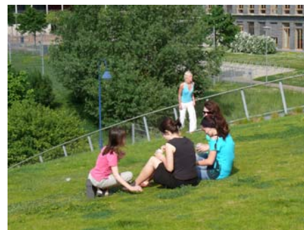
Das von beiden Seiten begehbare Dach wird im Sommer gern als Aufenthaltsfläche genutzt.