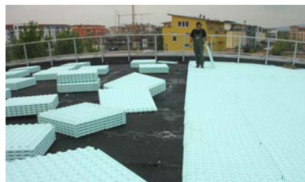
Verlegung der Floratherm® WD 65-H Elemente.