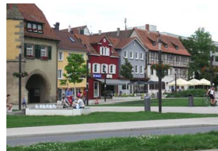
Die neu angelegte Freifläche vor dem Tübinger Tor wirkt modern und offen.