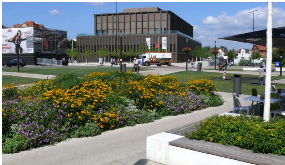
Die Tiefgaragenfläche vor dem Tübinger Tor und der Stadthallenplatz im Hintergrund bilden eine Einheit.