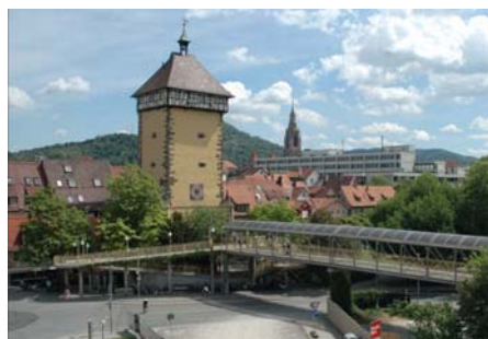
Vor der Sanierung versperrte die Fußgängerbrücke den Blick auf das historische Bauwerk.