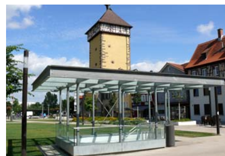
Der Treppenabgang zur Tiefgarage wurde ebenfalls modernisiert.