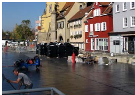
Nachdem die Tiefgarage abgedichtet wurde, konnte mit den gestalterischen Arbeiten begonnen werden.