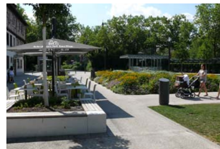
Um die Außengastronomie am Tübinger Tor zu beleben, wurde die Baumreihe von den Häusern entsprechend abgerückt.