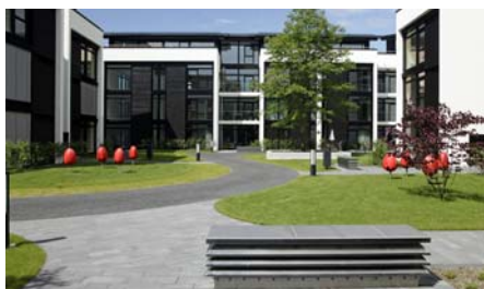
Um den schmalen Zuweg im Notfall befahren zu können, wurde ein Seitenstreifen als Schotterrasen angelegt.