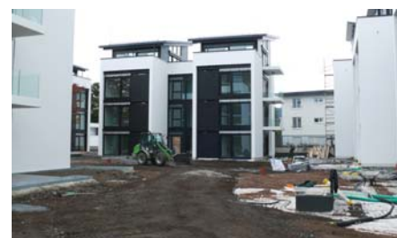
Mittels Radlader wird die Systemerde „Dachgarten“ auf der Tiefgarage aufgebracht.