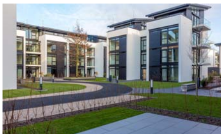
Sowohl der parkähnliche Innenhof als auch die Privatterassen liegen auf der massiven Tiefgaragendecke.