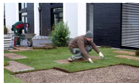
Der Rollrasen wird auf der Systemerde, dicht an dicht, verlegt.