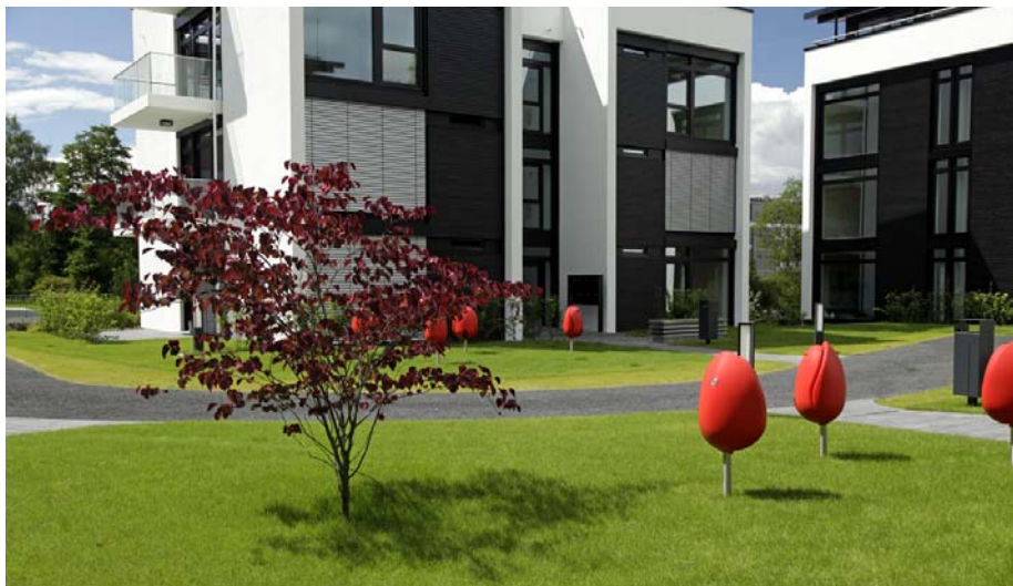
Sitzmöbel in Tulpenform laden zum Verweilen auf der Tiefgarage ein.