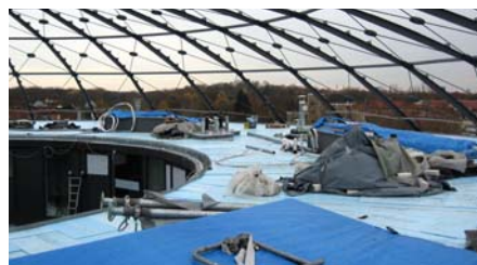
Die Dächer der Einfamilienhäuser wurden als Umkehrdach ausgebildet.