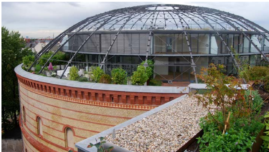
Blick auf den „Fichtebunker“ vom nebenan errichteten „Lofthouse“.