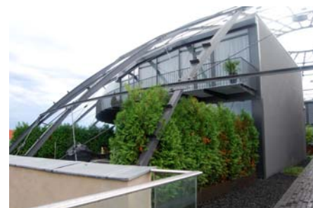
Die Terrassenflächen sind durch Hecken oder Spaliere voneinander abgegrenzt; die Rasenfläche kann jedoch gemeinsam genutzt werden.