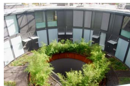
Der begrünte Innenhof, von dem aus die einzelnen Wohnungen zugänglich sind.