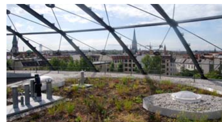
Diese Dächer wurden extensiv begrünt.