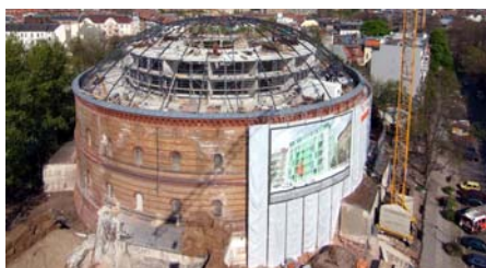
Auf dem ehem. Gasometer wurden 13 tortenförmige Einfamilienhäuser gebaut.