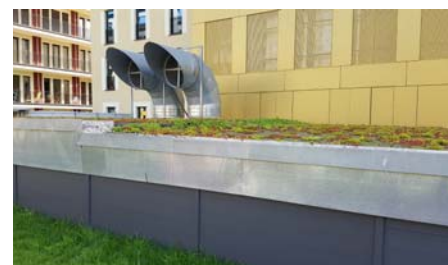
Selbst die Flächen um die Lüftungsanlagen etc. wurden extensiv begrünt.