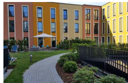
Ein Teil des Daches kann von den Hotelgästen genutzt werden.