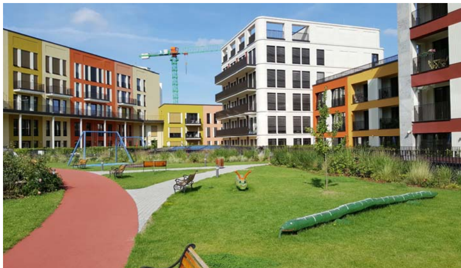
Diese abwechslungsreich gestaltete Fläche zwischen den Wohngebäuden befindet sich auf einem Dach!