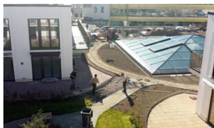
Kurz vor Vollendung der Dachbegrünungsarbeiten sind die einzelnen Bereiche schon gut erkennbar.