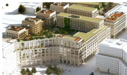
Das Rendering der Architekten zeigt, dass die Dächer der Wohneinheiten auch begrünt wurden.