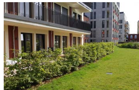
Um die Privatsphäre der Bewohner zu wahren, wurden die „Reihenhausgärten“ mit Sträuchern von der restlichen Dachfläche abgegrenzt.