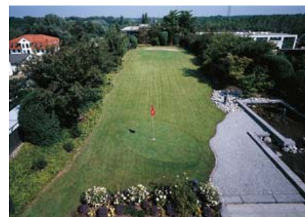
Eine bunte Gehölzemischung aus Forsythien, Weigelien, Sommerflieder und Felsenbirnen säumt das kleine Golfareal und wirkt als Windschutz.