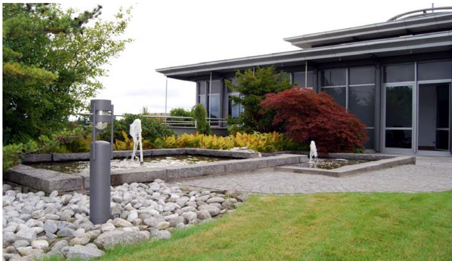
Die Pflasterfläche bildet einen harmonischen Übergang zwischen den Wasserbecken und dem Putting Green.