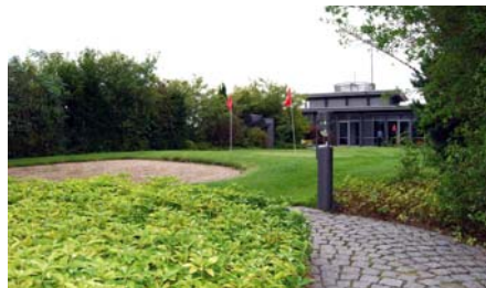
Der Sandbunker im hinteren Teil des Daches macht das Spiel anspruchsvoller.