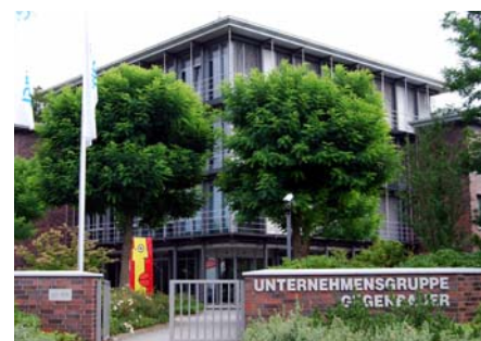
Auf dem 15 m hoch gelegenen Dach des Verwaltungssitzes einer Firma in Brandenburg geht es sportlich zu.