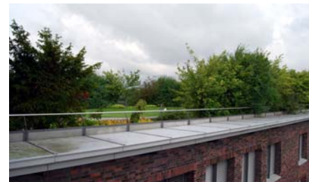
Die umfassende Hecke auf dem Dach ist mittlerweile zu einem Vogelparadies geworden.