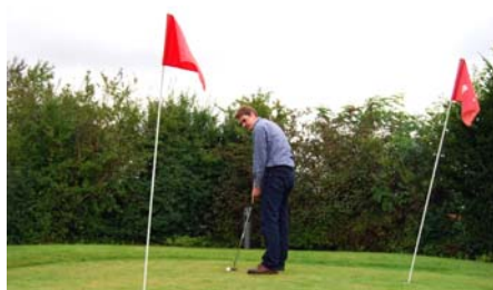
Dieser Drei-Loch-Golfplatz lockt zum Schlägerschwung in der Mittagspause ein.