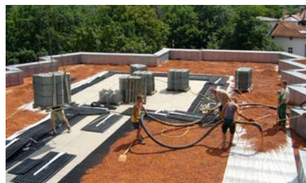
Das Dachbegrünungssubstrat wird mittels Silozug pneumatisch auf das Dach befördert.