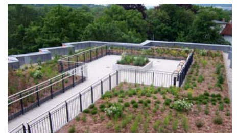
Der begrünte Dachgarten ca. ein halbes Jahr nach Fertigstellung.