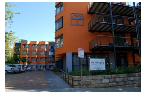
Beide Flügel des L-förmigen Neubaus des Pflegeheims „Am Villengang“ sind mit barrierefrei zu erreichenden Dachgärten ausgestattet.

obersten Geschoss zwei attraktiv gestaltete Gründächer mit Terrassenflächen und einer Panoramaaussicht über Jena sowie eine Sauna zur Verfügung. Als Systemaufbau wurde der Begrünungsaufbau „Dachgarten“ gewählt, bei dem es sich um einen multifunktionalen Begrünungsaufbau mit hoher Wasserspeicherung für Rasen, Stauden und bei höherer Substratschüttung auch für Sträucher und sogar Bäume handelt.