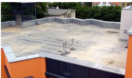
Das wurzelfest abgedichtete Dach vor Beginn der Begrünungsarbeiten.