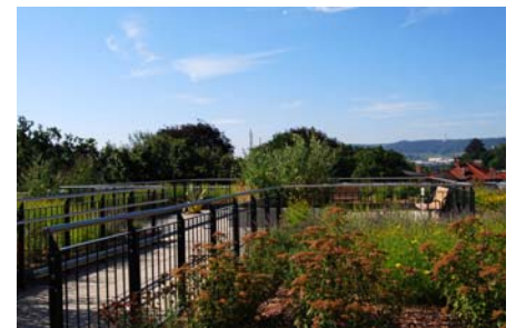
Die Pfosten des Geländers wurden ohne Dachdurchdringung auf der ZinCo Geländerbasis GB montiert.