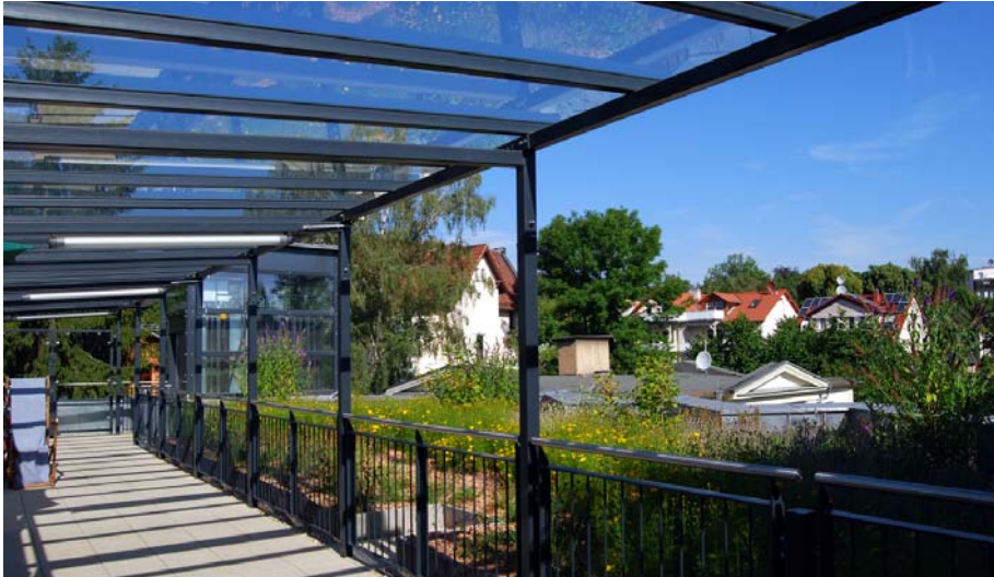
Einer der beiden attraktiv gestalteten Dachgärten ist auch bei Regen nutzbar.