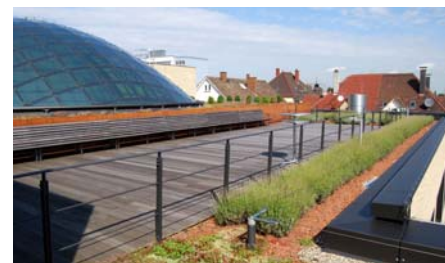
Die Dachfläche über dem Veranstaltungsraum wurde als Terrasse ausgebildet.