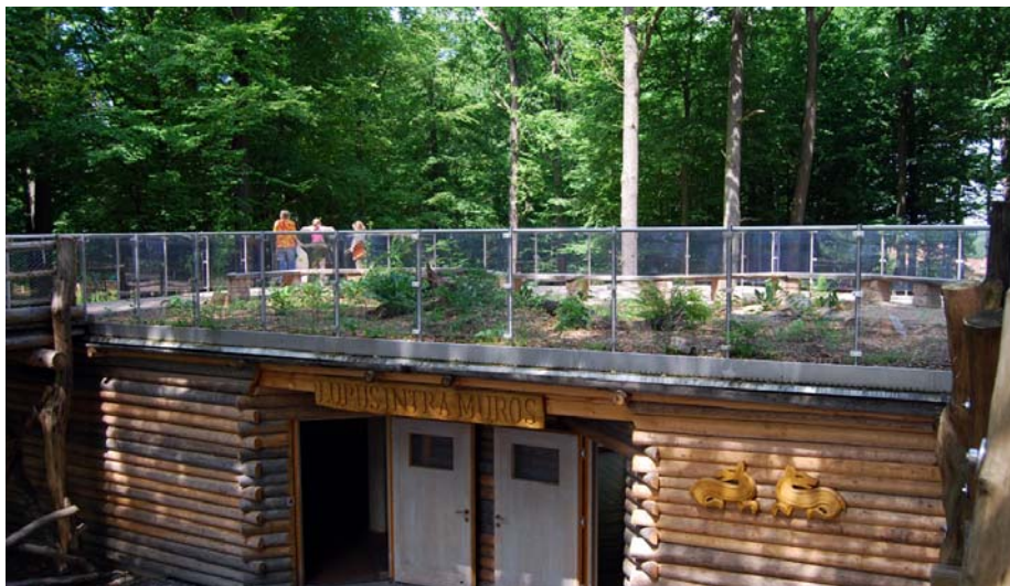
Die Besucherterrasse auf dem Info-Pavillon des neuen Wolfsgeheges.