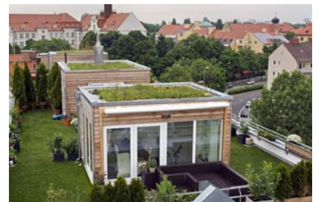
Auch die Holzkuben mit Wintergartencharakter sind mit Mauerpfefferarten extensiv begrünt worden.