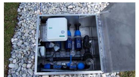
Der Bewässerungs-Manager BM 4 regelt die bedarfsgerechte Wasserzufuhr.