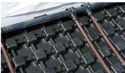
Über die Tropfschläuche, welche in die Aquatec® AT 45-Elemente eingeklipst werden, erfolgt die Bewässerung.