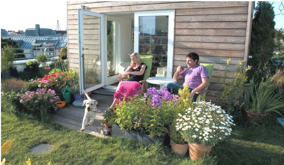
Gemütliches Zusammensein im eigenen Garten über den Dächern von München.