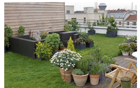
Die Holzterrassen beherbergen Sitzmöbel, Kübelpflanzen sowie selbstgezoogenes Gemüse und Wein.