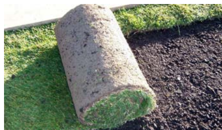
Die Firma Schwab kultiviert und liefert den artenreichen Kräuterrasen Typ „Sommerwiese“.