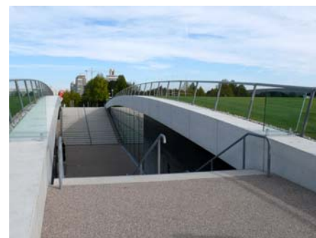
Bis auf den Geländeeinschnitt, der als Zugang dient, ist die Veranstaltungshalle komplett begrünt.