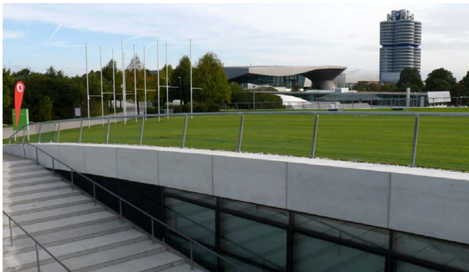
Die Kleine Olympiahalle wurde unterirdisch in die Landschaft des Parks eingebettet.