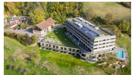
Das Hotel Achalm im Landschaftsschutzgebiet aus der Vogelperspektive.