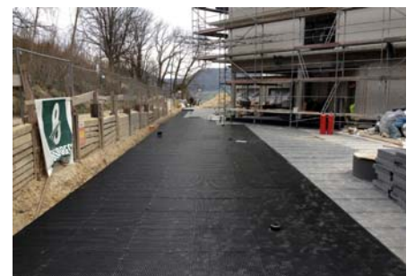
Im Zufahrtsbereich wurde Elastodrain® EL 202 vollflächig verlegt und mit passenden Verbindern fixiert.