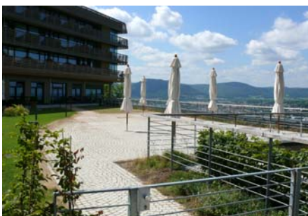
Die Gäste gelangen unter anderem über die Terrasse ins Hotel.