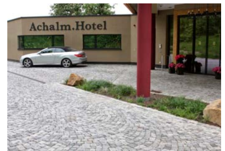
Vor dem Hoteleingang und der Zufahrt kam ein Belag aus Granitpflaster – und zwar aus gebrauchten Natursteinen – zum Einsatz.