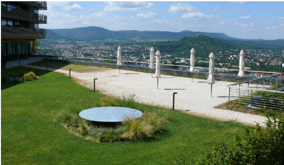
Die Pflanzen auf der Terrasse haben ihren Ursprung im süddeutschen Bergland in dem auch die Achalm liegt.