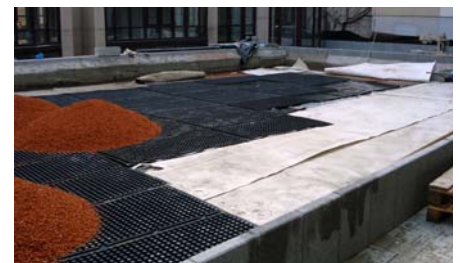
Verlegung von Stabilodrain® SD 30 Elementen in einem Innenhof.