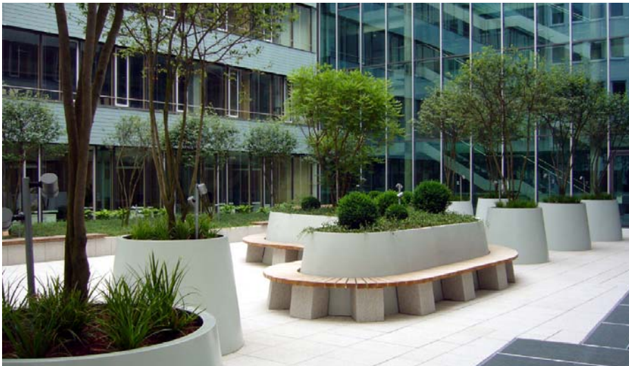
Der begrünte Innenhof mit den Pflanzkübeln aus Glasfaserkunststoff.