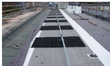
Das Absturzsicherungssystem Fallnet® SR Rail kam auf den oberen Dachflächen zum Einsatz.