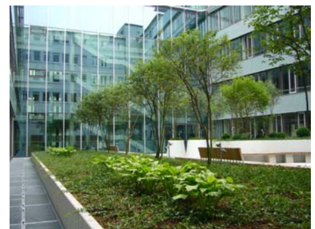
Eine der Innenhofbegrünungen kurz nach der Fertigstellung...