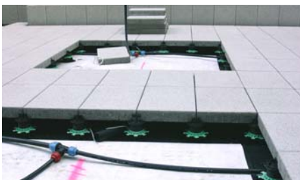
Der Hohlraum unter dem aufgeständerten Plattenbelag bot Platz für die Bewässerungsleitungen.