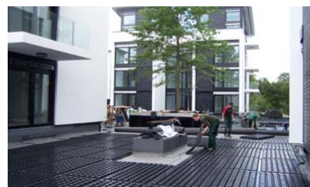
Die Verlegung der Floradrain® FD 60-Platten erfolgt lose mit ca. 3–4 cm Überdeckung der Ränder. Um das Dränelement belastbar zu machen, wird es mit Zincolit® Plus verfüllt.