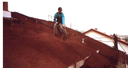
Die Systemerde „Lavendelheide“ wurde im Silozug angeliefert und aufs Dach „geblasen“.