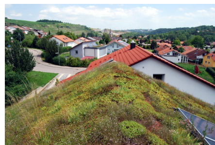
Sieben Jahre später, im Sommer 2009, zeigt sich die Vegetation nach wie vor geschlossen und vital.

von 10 cm sichert in Verbindung mit einer dicken Wasserspeichermatte genügend Wasserrückhalt, so dass nicht nur genügsame Sedum-Arten sondern auch andere Stauden, insbesondere verschiedene Nelkenarten, Gräser und Kräuter verwendet werden konnten. Die Möglichkeit einer Bewässerung in Trockenperioden wurde trotzdem vorgesehen.