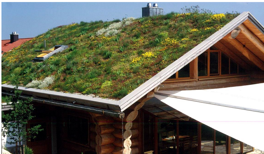
Inmitten von Ziegeldächern – das Blockhaus Schmid in Rosswag.