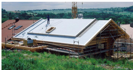
Die zu begrünende Dachfläche wird mit einer wurzelfesten Kunststoffbahn abgedichtet.