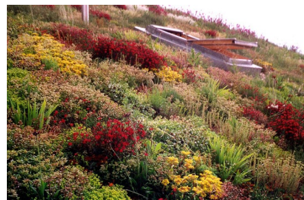
Die Begrünung während der ersten Blüte im Juni 2002.