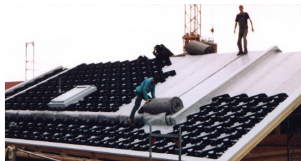
Auf der Wasserspeichermatte WSM 150 werden beginnend von unten die Georaster®-Elemente verlegt.