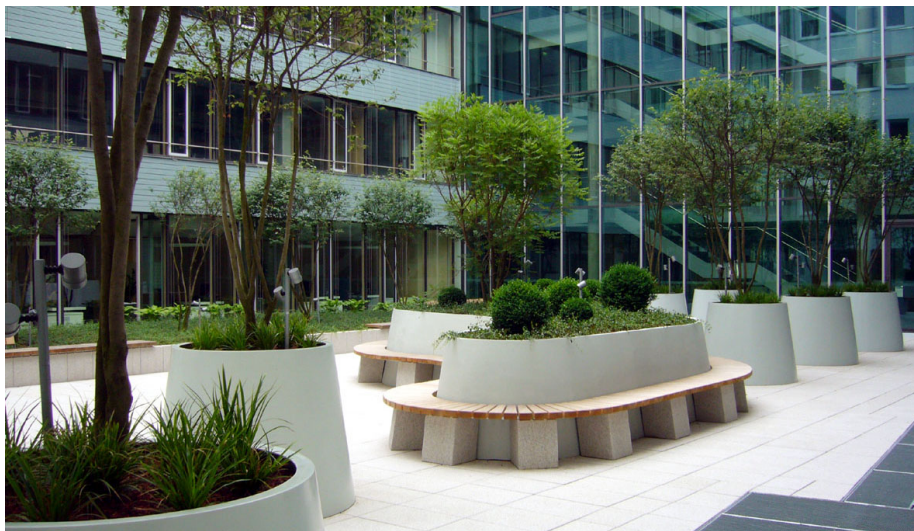
Der begrünte Innenhof mit den Pflanzkübeln aus Glasfaserkunststoff.