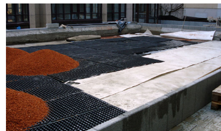
Verlegung von Stabilodrain® SD 30 Elementen in einem Innenhof.