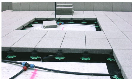
Der Hohlraum unter dem aufgeständerten Plattenbelag bot Platz für die Bewässerungsleitungen.