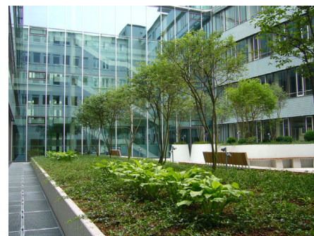
Eine der Innenhofbegrünungen kurz nach der Fertigstellung...