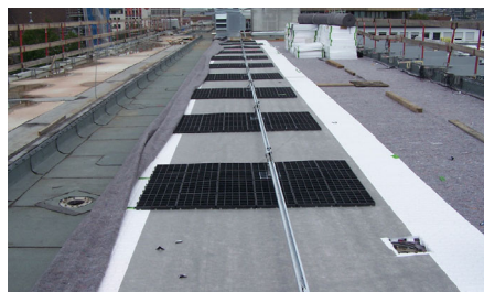
Das Absturzsicherungssystem Fallnet® SR Rail kam auf den oberen Dachflächen zum Einsatz.