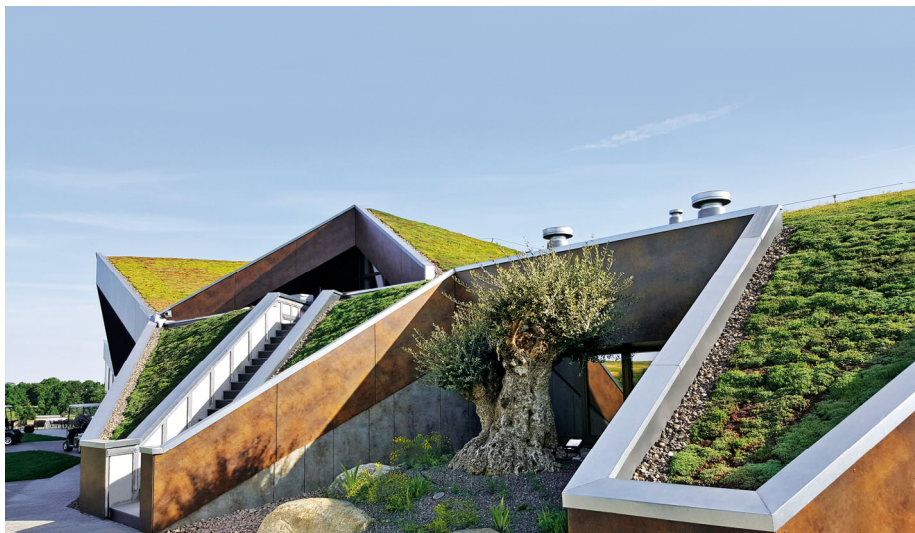
Das Dach des neuen Golfclubhauses hat unterschiedliche Formen und Neigungen.