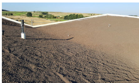
Die Dachfläche kurz nach dem Aufbringen der Systemerde „Steinosenflur“.