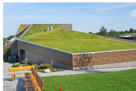
Die ca. 2.000 m 2 große Dachfläche wurde vollflächig mit Floraset® FS 75-Elementen begrünt.

Koordinaten: 51° 0'32.08"N 13°29'53.54"E