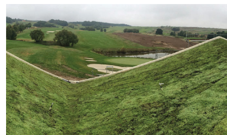
Die ca. 2 m 2 großen Pflanzenmatten wurden dicht an dicht, ohne Überlappung verlegt.