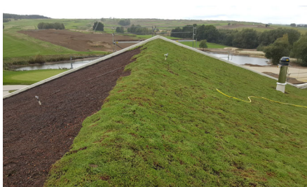
Zur schnellen Flächendeckung wurden vorkultivierte Sedumatten verlegt.