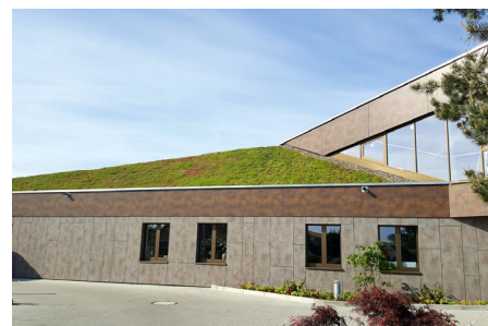
Seit 2017 ist die Dachbegrünung nun Bestandteil der Golfanlage Herzogswalde in Wilsdruff.