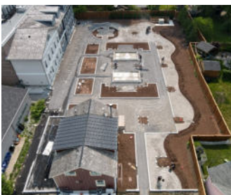
Die im Bau befindliche Dachfläche kurz vor dem Verlegen der Terrassenplatten und der Bepflanzung.

Der hier verwendete Systemaufbau mit Floradrain® FD 40 entspricht einem multifunktionalen Gründachaufbau mit hoher Wasserspeicherkapazität. Er eignet sich am besten für Rasenflächen, mehrjährige Pflanzen wie Stauden, Sträucher und Bäume. Darüber hinaus ist dieser Aufbau auch für Plattenbeläge geeignet.