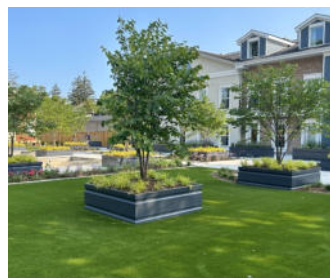
Die Rasenfläche rund um den Dachgarten bildet einen grünen Rahmen.