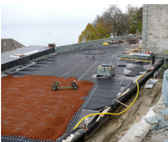
Das Drän- und Wasserspeicherelement Floradrain® FD 60 stellt sicher, dass die Entwässerung des Daches über die beiden Schmalseiten funktioniert.

für den Neubau von den Büros Hein, Bregenz und Steinmann, Winterthur ging als Sieger aus einem Architekten-Wettbewerb hervor. Auf das bewusst gefällelos geplante Dach wurde der Systemaufbau Dachgarten mit Floradrain® FD 60 aufgebracht. Außergewöhnlich war, dass die Dachbegrünung nicht zu schwer und auch nicht zu leicht werden durfte, da das Gewicht des Gebäudes inklusive Begrünung dafür zu sorgen hat, dass das Gebäude dem Hangdruck standhält.