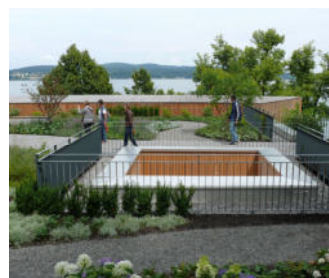
Um die Lichthöfe und an den Absturzkanten wurden vom Schlosser gefertigte Geländer an Zinco-Geländerbasen befestigt.