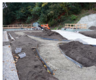
Wege und Pflanzflächen während der Garten- und Landschaftsbauarbeiten.