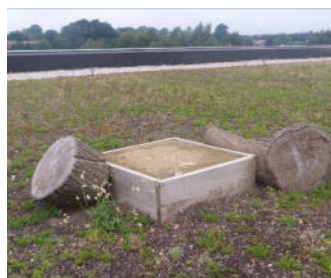
Totholz und Sandlinsen nützen heimischen Tierarten als Lebensraum und Brutstätten.