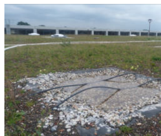
Gezielt angelegte Wasserflächen verbessern das Wasserangebot für Insekten und Vögel.