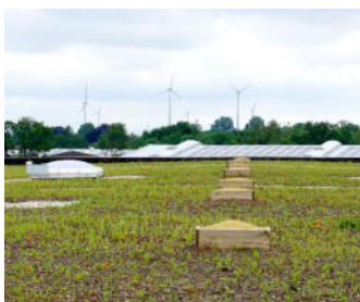
Mit dem Frühling beginnt die Vegetationsperiode und zartes Grün kommt zum Vorschein.

Auf abgegrenzten Bereichen wurden als hochwertigste Form der Vegetationsansiedlung zertifiziertes gebietseigenes Saatgut und samenhaltiges Rechgut aus Sand-trockenrasen der Region, das auch Moose und Flechten enthielt, auf den vorbereiteten Substratflächen ausgebracht. Ergänzend wurden Sedum-Sprossen gebietseigener Herkunft verwendet. Genau diese regionaltypischen Arten stellen das passende Nahrungsangebot für viele heimische Tierarten dar.