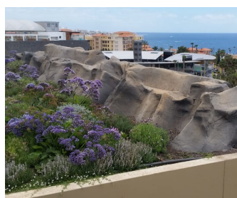
Bereits ein halbes Jahr nach der Bepflanzung haben sich die sorgfältig ausgewählten, ans Klima angepassten Pflanzen zu einem wunderschönen Blütenteppich entwickelt, sowohl in der Schräge als auch auf den Flachdachbereichen.

Neigung von max. 35° seine natürlichen Grenzen, und so mussten viele Faktoren zusammenspielen, um bei einer darüber-hinausgehenden Dachneigung eine Begrünung ausführen zu können. Neben einer funktionssicheren Technik spielten während der Installation auch andere Faktoren eine wichtige Rolle. Vor allem ist der Enthusiasmus und das Engagement aller Beteiligten zu nennen, welche den Erfolg des Projekts nie in Frage gestellt haben.