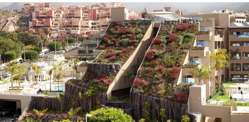
Der Blick auf die spektakulären Steildächer des Luxushotels Victoria GF mit einer Neigung von bis zu 45°.