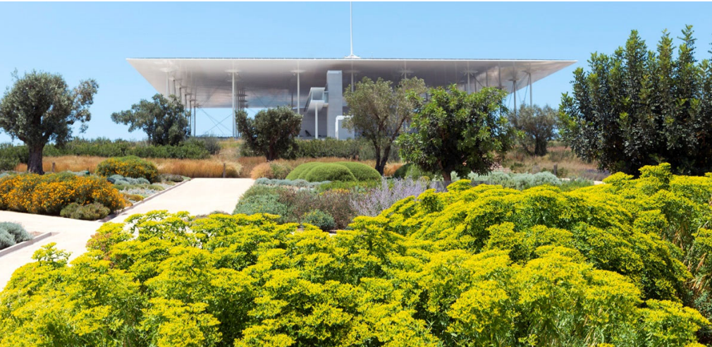
Über der Dachterrasse der Oper befindet sich ein etwa 10.000 m 2 großes Solardach.