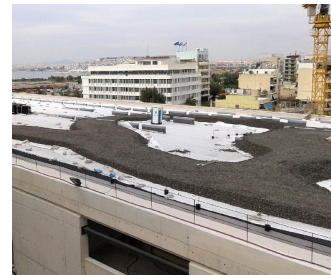
Um teilweise höhere Aufbauten zu erreichen kam Schaumglasschotter zum Einsatz.