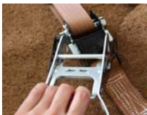
Ratschenhebel nach Spannen der Gurte abnehmbar

Speziell für Baumpflanzungen auf Gebäuden konzipiertes, durch Auflast gehaltenes und lastverteilendes Verankerungssystem für Wurzelbälle.