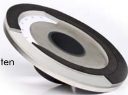
Ansicht von unten

Durch Eigengewicht gehaltener, regulierbarer Drosselaufsatz für Flachdachabläufe mit Anschlusskragen.