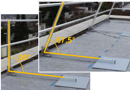
Aufstellwinkel 90° oder 67,5°

Durch Auflast gehaltenes Arbeitsschutzgeländer nach EN 13374 Klasse A für temporäre Arbeiten auf extensiv begrünten Flachdächern mit Attika.