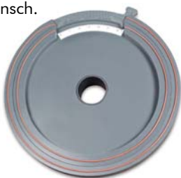
Ansicht von unten

Durch Eigengewicht gehaltener, regulierbarer Drosselaufsatz für Flachdachabläufe mit Schraubflansch.