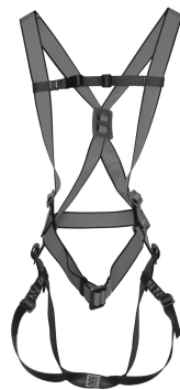
Auffanggurt nach EN 361