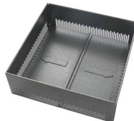
Transportzustand (Flansch eingeschoben)