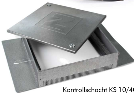
Kontrollschacht KS 10/40