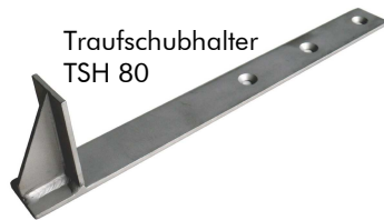
Traufschubhalter TSH 80

Stabiles Winkelprofil aus Edelstahl mit Entwässerungsschlitzen und Lochung im Auflageschenkel zur Fixierung auf der Dachabdichtung.